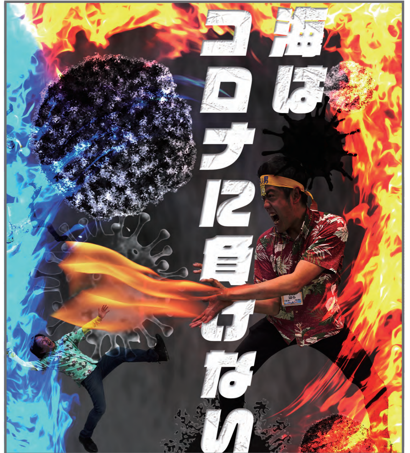
今月の表紙と中面背景→モデルは管理者〇〇さん！