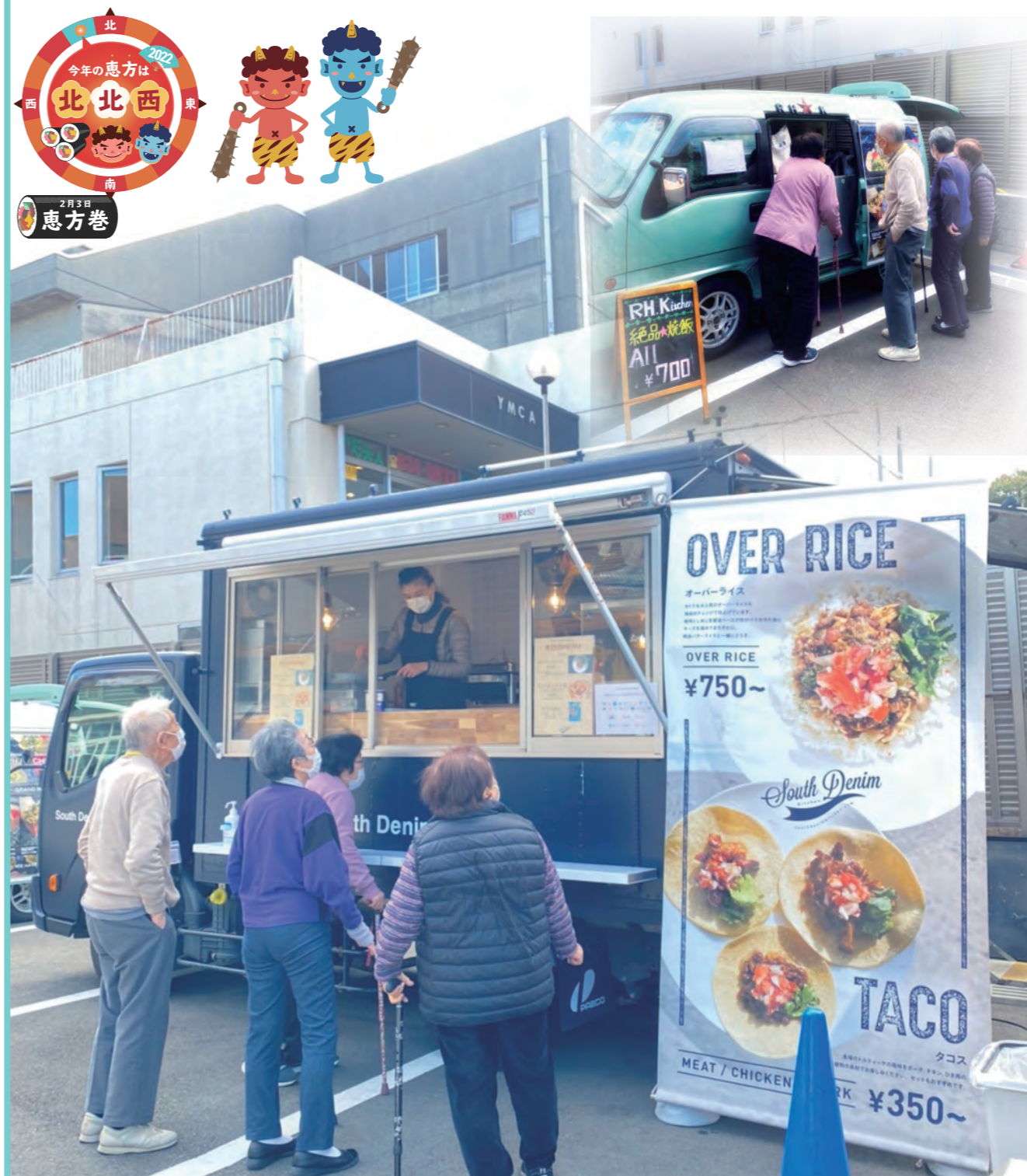
おしゃれなキッチンカーが並ぶ根岸店駐車場（オーバーライス&絶品炒飯）