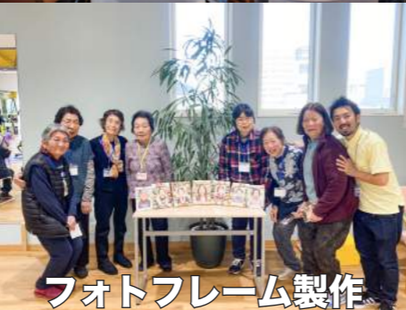
フォトフレーム製作