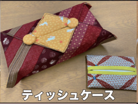
ティッシュケース