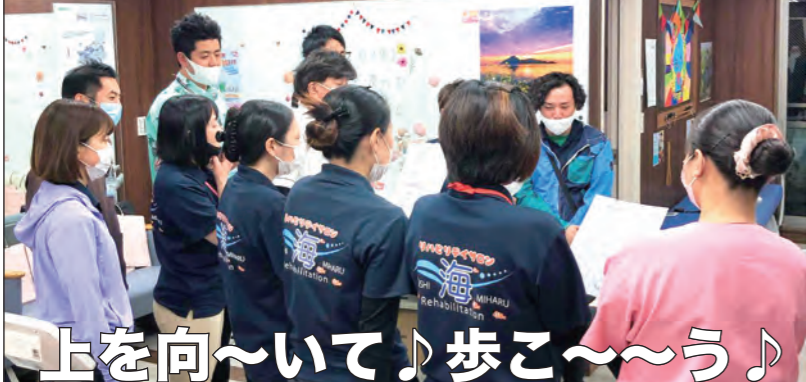
上を向いて歩こう♪